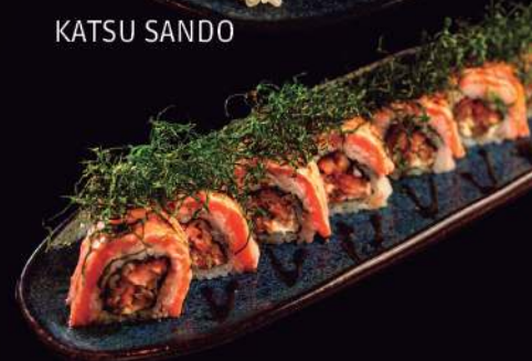
URAMAKI SALMÃO CROCANTE