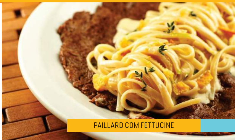
PAILLARD COM FETTUCINE