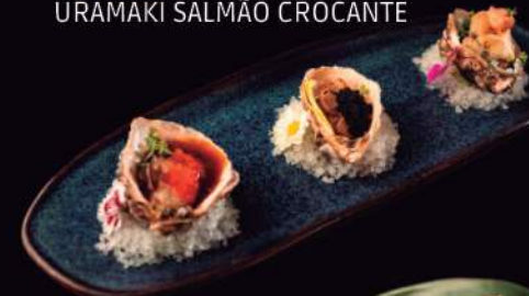
TRIO DE OSTRAS