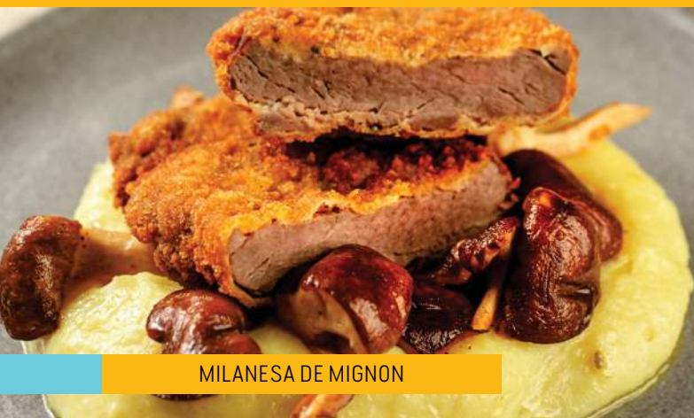
MILANESA DE MIGNON