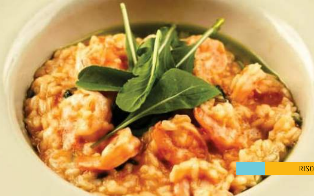
RISOTO DE CAMARÃO